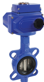
КПП-Б7-065 с ЭПР1-008