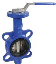
КПП-Б7-065 с ПРК-032*