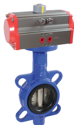
КПП-Б7-065 с ППР2-063