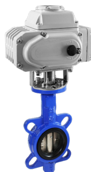
КПП-Б7-065 с ЭПР7-010